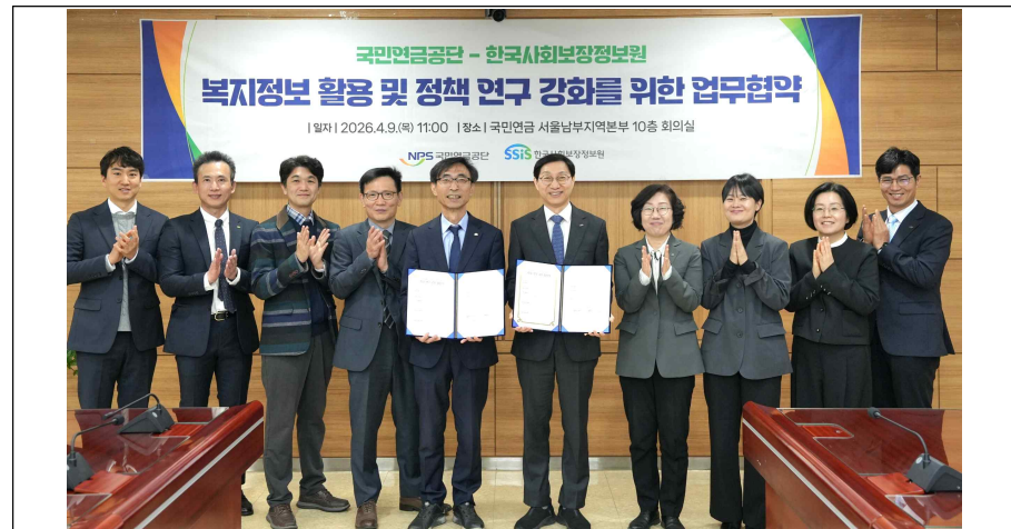
[사진 설명: 국민연금공단 서울남부지역본부 회의실에서 한국사회보장정보원 김현준 원장(왼쪽)과 김성주 국민연금공단 이사장(오른쪽)이 업무협약 체결 후 기념 촬영을 하고 있다.

김성주 국민연금공단 이사장은 “양 기관의 전문성이 시너지를 발휘하여 국민이 체감할 수 있는 실질적인 복지 서비스 개선으로 이어질 것” 이라고 말했다.